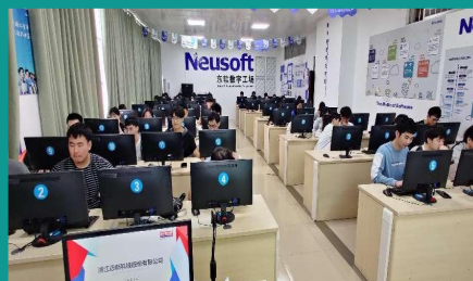
东软软件学院开展线上工坊活动