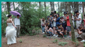
数字媒体艺术专业开展课程实践