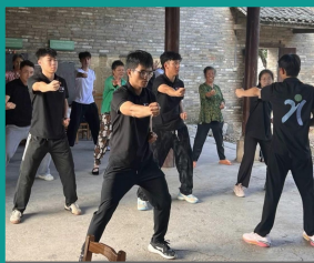
学生在草坪回族乡进行八段锦教学