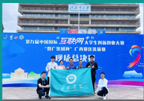
学生参加第九届中国国际“互联网+”大学生创新创业大赛