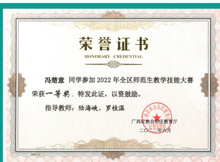
学生参加2022师范生技能大赛荣获一等奖

基础泰语、泰语视听、泰语会话、泰语阅读、高级泰语、商务泰语、旅游泰语、泰语口译、泰语笔译等。