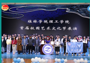
理工学院举办第十六届科技文化节开幕式暨首届校园文化艺术节活动