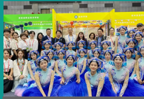
教育学院舞蹈专业师生出征中国-东盟职业教育展暨论坛