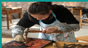
工艺美术专业锻造作业