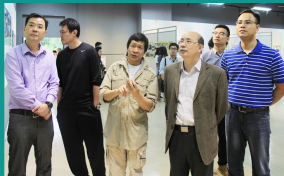
自治区教育厅副厅长蔡昌卓先生到我院指导工作