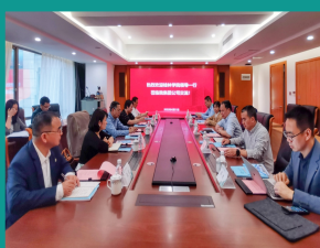
传媒与新闻学院赴广西师范大学出版社集团开展交流活动