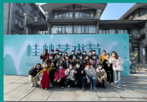
教育学院师生受邀参加桂林艺术节杂技魔术剧场戏剧实践和东西巷街头戏剧巡演

音乐表演方向：中外音乐史与作品赏析、钢琴演奏、歌曲演唱、伴奏与弹唱、合唱指挥、作曲技术基础。