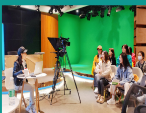
播音与主持艺术专业在虚拟实景电视演播室进行教学