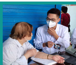
学生前往老年人协会开展义诊

体育概论、运动解剖学、运动生理学、体育心理学、体育社会学、健康教育学、体育科学研究方法、康复评定学，运动康复治疗技术、肌肉骨骼康复、运动创伤学、贴扎术、针灸推拿等。