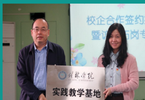
教育学院赴广西师范大学实验幼儿园举行实践教学基地挂牌仪式