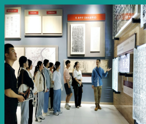
人文学院半步斋书法研学活动