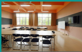
卓越设计人才培训基地教室