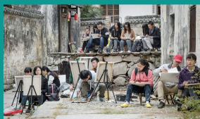
学院师生赴皖南采风