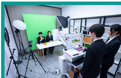
学生在互联网直播实训室直播间进行直播实训

管理学原理、旅游目的地管理、旅游消费者行为、旅游接待业、旅游学概论、旅游法规、酒店（民宿）概论、民宿管家服务、民宿服务营销、民宿产品开发、民宿新媒体运营与管理、健康管理学、康养旅游住宿服务、茶文化与茶艺、酒水服务与吧台管理等。