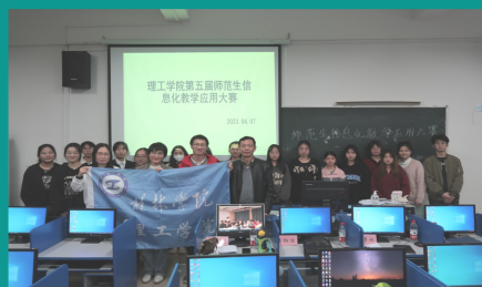
理工学院第五届师范生信息化教学应用大赛评选活动