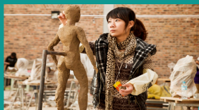
雕塑工作室学生正在进行作业练习