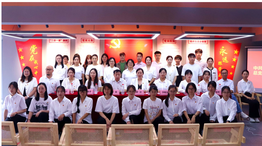
传媒与新闻学院党总支委员会第一次党员大会顺利召开

平面设计、数据结构、游戏引擎应用与开发、数据库原理与应用、游戏设计基础、游戏程序设计、游戏架构设计、虚拟现实技术、信息可视化设计、增强现实技术等。