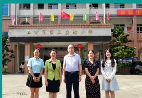
教育学院赴玉林市开展实习基地走访调研活动