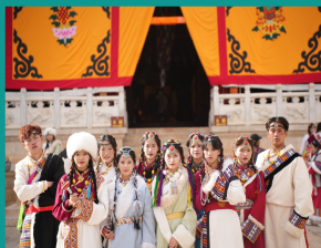
广播电视编导专业在香格里拉开展“与风同行”主题采风活动