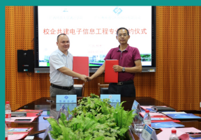
理工学院与粤嵌电子工程学院签约仪式

学院历届毕业生考取上海交通大学、深圳大学、宁波大学、广西大学、广西师范大学、桂林电子科技大学、昆明理工大学、桂林理工大学、广西民族大学、南宁师范大学等高校硕士研究生，毕业生就业落实率90%以上，为国家发展培养了一大批优秀人才。