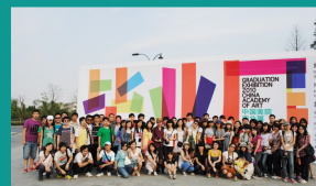
学院赴中国美术学院考察