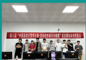
理工学院学子在第八届中国高校计算机大赛—团体程序设计天梯赛（国赛）中获得三等奖