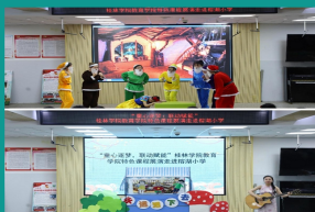
教育学院“童心逐梦，联动赋能”课程展演走进榕湖小学