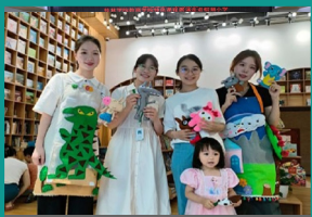
教育学院师生走进广西师范大学“魔法象”童书馆开展儿童故事会活动