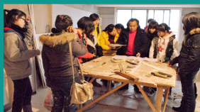
环境设计专业学生实训