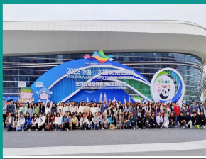
传媒与新闻学院组织学生参加2023中国—东盟博览会旅游展