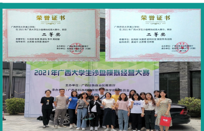
学生参加广西大学生沙盘模拟经营大赛