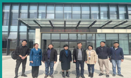
理工学院到桂林市经开区开展调研走访活动