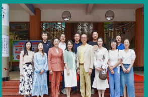
教育学院赴广东省深圳市、湛江市、广州市开展“访企拓岗促就业”专项行动