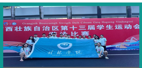
游泳代表队在全区第十三届学生运动会游泳比赛中获佳绩