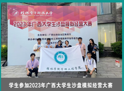
学生参加2023年广西大学生沙盘模拟经营大赛