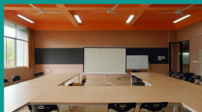
卓越设计人才培养基地教室