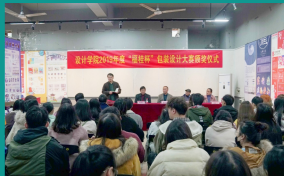
服务地方企业开展校企合作