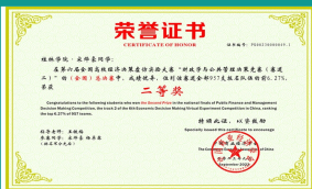
学生获全国高校经济决策仿真实验大赛全国总决赛第二名