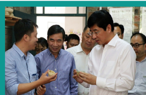
桂林市委书记周家斌到我院指导工作

近三年，获得自治区级、国家级立项50余项；教师指导学生在全国大学生广告大赛、全国数字艺术设计大赛、中国“互联网+”大学生创新创业大赛广西选拔赛、广西大学生艺术展演等国内比赛中屡获佳绩。