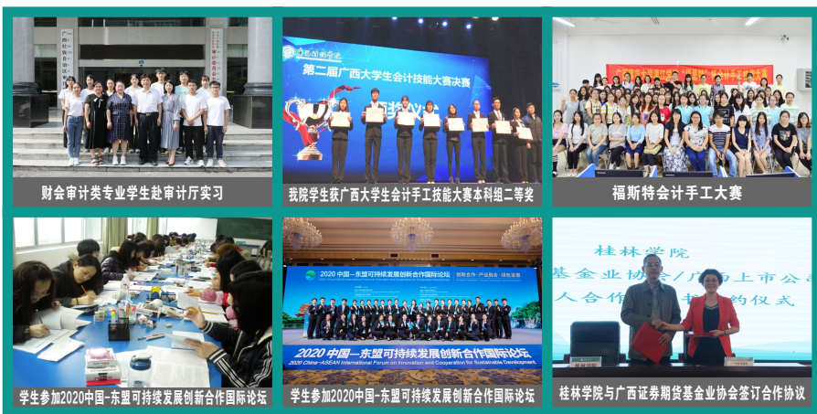
财会审计类专业学生赴审计厅实习

学院现有校内专业实验室20余间，包括“互联网直播实训室”“新商科软件实训室”“商务会展综合实训室”“酒店仿真实训室”“茶艺与酒水品鉴实验室”“名淘跨境电子商务实训室”“名淘电子商务孵化中心”“会计手工实训室”“财务审计实训室”“ERP模拟沙盘与财政学模拟沙盘实训室”等；与包括广西壮族自治区审计科学研究所、桂林市商务局、桂林市工商局、桂林市审计局、浙江名淘投资控股有限公司、桂林市信昌投资集团有限公司、三亚艾迪逊酒店、广西彰泰物业服务集团有限公司、桂林市物业行业协会、中国银行桂林分行、广西立信会计师事务所、广西九信会计事务所、中国建设银行桂林分行、桂林中国国际旅行社、桂林银行股份有限公司、中国工商银行桂林分行、中国银河证券、东方证券等50余家行业知名企业及地方单位建立校企（地）合作关系，形成产学研融合教育平台。