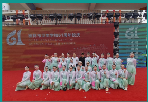
教育学院受邀参加桂林市卫生学校校庆活动