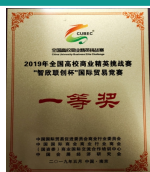
学生获得全国高校商业精英挑战赛暨国贸技能大赛一等奖