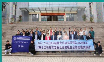
CCF YOCSEF桂林走进桂林学院东软软件学院Club活动

高级语言程序设计（C语言）、电路分析、模拟电子技术、数字电子技术、信号与系统、高频电子线路、通信原理、数字信号处理、微机原理，单片机技术及各类电子信息类产品实训。