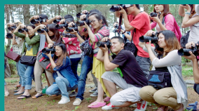
数字媒体艺术专业开展课程实践