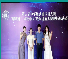
学生参加第五届中华经典诵读大赛之“诗教中国”诗词讲解大赛