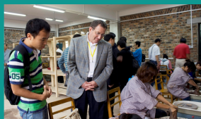
国际教育专家参观学院陶艺工作室