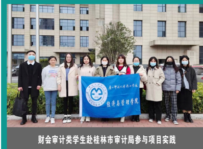
财会审计类学生赴桂林市审计局参与项目实践