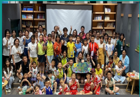
教育学院携手君武小学开展“健康地球，环保有我”主题活动