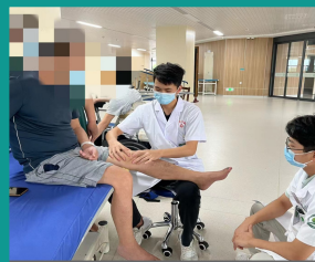
学生在骨科医院实习