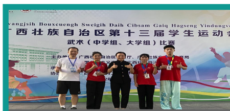
武术代表队在全区第十三届学生运动会武术比赛中获佳绩

学院重视学科竞赛工作，积极组织我院学生参加学科竞赛活动，并取得可喜的成绩。2024届毕业生在校取得的部分奖项如下：2022年全区师范生技能大赛获一等奖3项，二等奖2项，三等奖10余项；广西壮族自治区第十三届学生运动会，获金银铜共计40余块奖牌；2022年中国广西国际标准拉丁舞公开赛暨广西第二届拉丁舞锦标赛获9项第一、2项第二、3项第三；2022年广西壮族自治区学生羽毛球（大学组）比赛团体赛体育专业组男子团体第四名；广西壮族自治区第三届大学生舞龙舞狮锦标赛体育专业组传统舞龙第二名；第24届中国大学生篮球一级联赛广西选拔赛男子组第七名、女子组第八名；2021年广西第七届“千里杯”校园足球联赛（本科组）体育专业男子组第四名；2021年桂林市高校大学生气排球锦标赛专业男子组第一名、女子组第一第二名；2021年全区大学生游泳比赛1项第一、5项第三。师生团队共荣获国家级大学生创新创业立项4项，自治区级“挑战杯”大学生课外学术科技作品竞赛获奖5项，自治区级“互联网+”大学生创新创业大赛获奖1项。