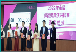
教育学院在2022年全区师德师风演讲比赛中获得佳绩