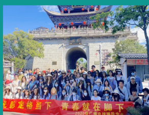
20广播电视编导专业开展“光影定格当下,青春就在脚下”教学实践采风活动

传媒与新闻学院成立于2018年12月(由原中文系和音乐与教育系部分专业合并而成),现开设有新闻学、播音与主持艺术、广播电视编导、数字出版及数字与媒体技术五个专业。自建院以来,传媒与新闻学院始终坚持以习近平新时代中国特色社会主义思想为指导,坚持马克思主义新闻观,坚持立德树人根本任务,为党育人,为国育才。凝心聚力,在常规工作有序进行的基础上,努力贯通各个专业节点,形成专业合力,协同发展;积极与各个协议共建合作单位协商,各专业不断增加及参与媒体融合实践,利用各种媒体平台,努力提升专业抗震能力,提高教学质量和实践操作能力及就业率。为突出应用型人才培养,全力打造专业特色,传媒与新闻学院设特色实训室(融媒体实训室),逐步将传媒与新闻学院建构成为媒体融合的有机整体。为适应现代社会快速发展需要,传媒与新闻学院在办学中充分利用各种现代教育技术手段,培养学生的综合性、复合型、实践操作性能力,现建有现代化的媒体融合实训室5间,网络化教学平台及实训平台8个,覆盖四个专业和全部学生,能满足各专业学生教学实践及提升相关能力的需要。传媒与新闻学院重视对外交流工作。现有校外实习基地10个,与区内外电视台、广播台、网络媒体都建立了合作共建关系。