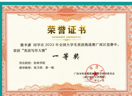
学生参加全国大学生英语挑战赛荣获“英语写作大赛”一等奖