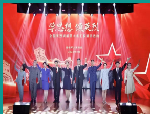
传媒与新闻学院校友在全国英烈讲解员大赛中获佳绩并应邀赴京汇报展示