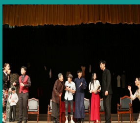
暖心大戏《旧家一天伦之战》