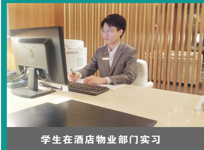
学生在酒店物业部门实习