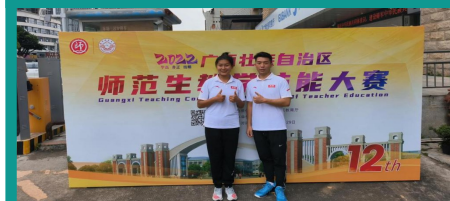
学生在2022年广西师范生教学技能大赛中获高中组、初中组双冠军