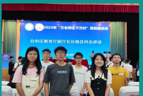
教育学院毕业生代表参加了由广西壮族自治区教育厅主办的“万名师生下农村”项目推进会