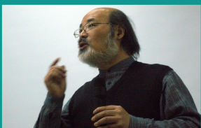
书籍设计大师吕敬人先生来我院讲学