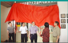
卓越设计人才培训基地揭牌