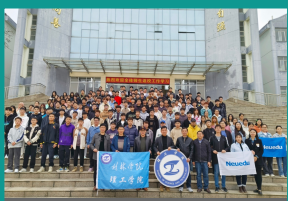
理工学院2022级软件工程专业学生就业保障协议签约仪式