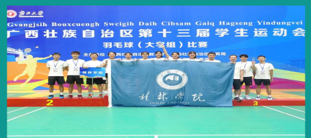
羽毛球代表队在广西第十三届学生运动会羽毛球（大学组）比赛中获佳绩