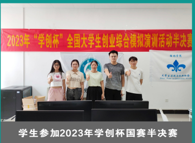
学生参加2023年学创杯国赛半决赛